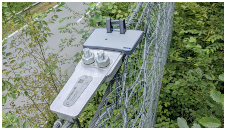
Installierter Geobrug GUARD in einer Schutzverbauung neben einer Strasse.

Die gemessenen Daten werden in festgelegten Intervallen regelmässig übers Mobilfunknetz an einen Server übermittelt und können über ein Dashboard abgerufen werden. Hier erfolgt eine grafische Aufbereitung der Daten, was die Anwendung auch für den Endkunden nutzbar macht. Die Korrosionsdaten werden in eine Korrosionsrate umgerechnet und nach EN ISO 12944-2 in eine Korrosivitätsklasse eingeordnet.