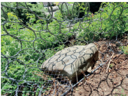
Durch einen Geobrugg GUARD registrierter Steinschlag an einer Schutzverbauung (Felsblock mit ca. 1000 kg).

Dem Kunden steht mit dem Geobrugg GUARD ein umfangreiches Überwachungswerkzeug zur Verfügung, mit dem Inspektionsintervalle und Wartungsarbeiten gezielter und effektiver geplant werden können. ■